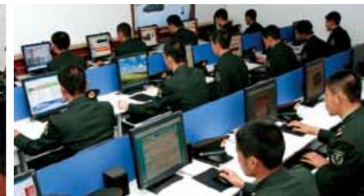
利用多媒体平台延伸教育课堂