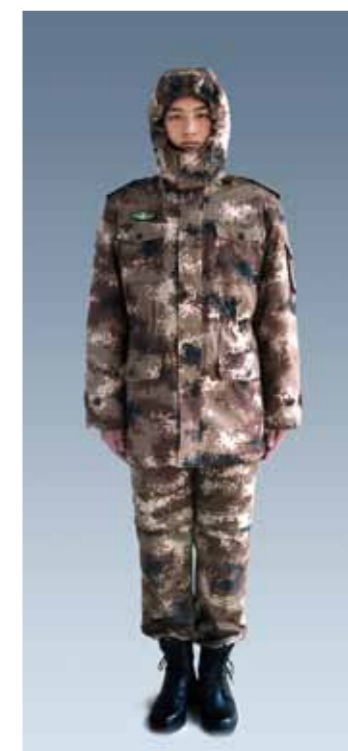
陆军冬季迷彩作训大衣