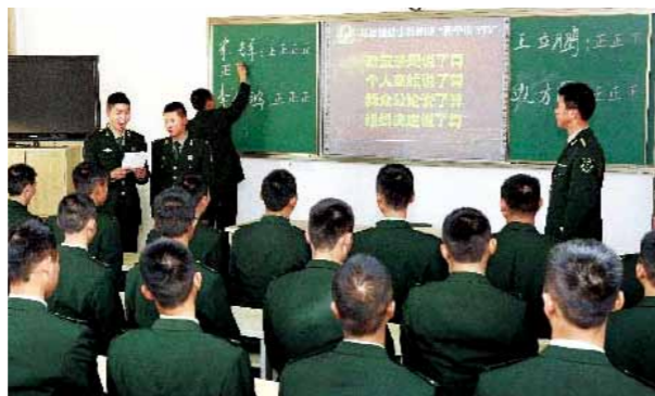
选取士官连队民主测评会

(5) 具有全日制大专以上学历的士兵考入士官学校后，可参加高技能人才培养班，修满规定课程和学分的，发给职业技术教育本科毕业证书和学位证书；毕业后原则上服役至四级军士长，获得技师资格的，优先选取为高级士官。