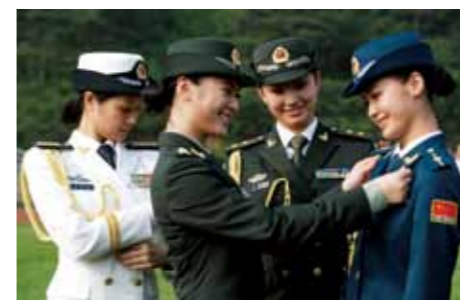
试穿军服的女军官

武警警服包括：春秋常服为橄榄绿色，夏常服为浅橄榄绿色，冬常服为深橄榄绿色，作训服为通用迷彩和数码荒漠迷彩。